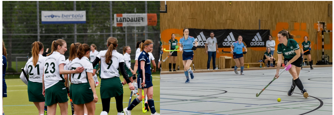
Kleiner Banner Feld/Halle